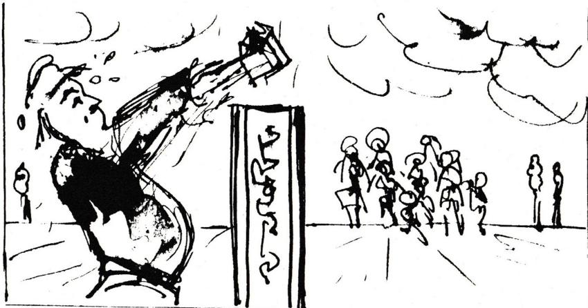
het 'slaan' van de eerste paal

Binnen de groep realiseren wij ons dat het nu menens wordt. Standpunten verhardden zich. Menigeen vraagt zich af wààr je teveel van jezelf inlevert ten behoeve van het geheel en waar je je duidelijk moet profileren nu het nog kan. Als je er eenmaal woont is het moeilijker een stap terug te doen. Achteraf beredeneerd een natuurlijk onderdeel van het proces. Destijds bar lastig!