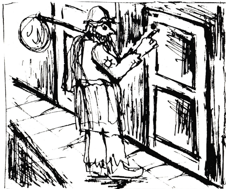
'tijdelijke hulpverlening aan derden'

Het punt hulpverlening d.m.v. tijdelijk onderdak aan derden geeft veel discussie tussen voor- en tegenstanders. Uiteindelijk vindt iedereen zich in de stelling dat je, zeker de eerste jaren, nodig zult hebben om aan elkaar te wennen en je als groep sterk moet staan om mensen van elders op te vangen. Vergaderen gaat steeds beter. We kunnen al een halve avond voorbeeldig naar elkaar luisteren en elkaar laten uitpraten. De verslaggeving over de voortgang van wel/niet bouwen is zò'n zware materie, dat je daar ook wel stil van wordt! En we blijven luisteren en hopen dat er meer zekerheid komt.